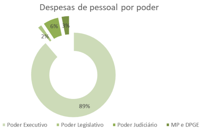
Gráfico 3 – Composição da Despesa de Pessoal por Poder

Obs: Composição desconsiderando a despesa Intra-orçamentária